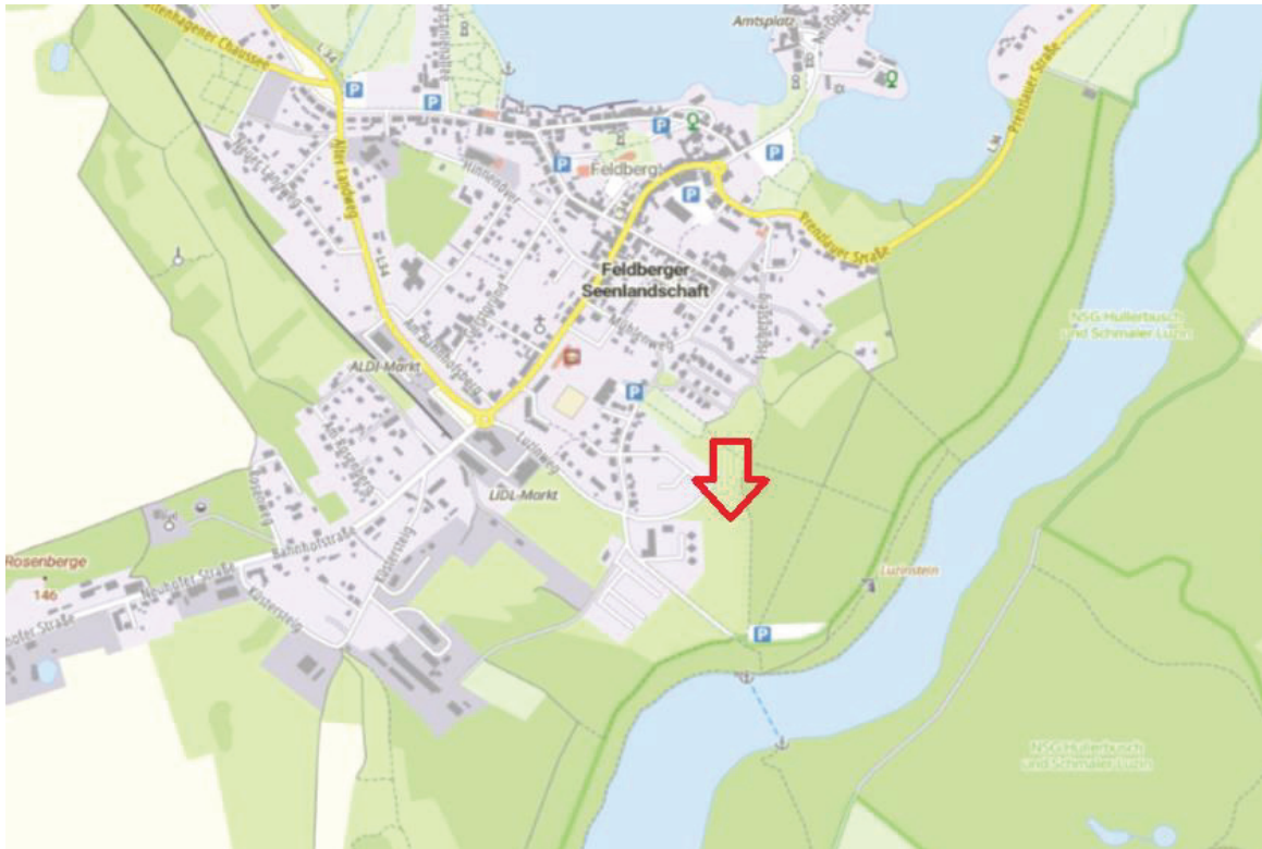
Abbildung 11, Standort CEF-Maßnahme Feldberg.

Die Angaben in den Kapiteln 5.4.1 und 5.4.2 stammen aus der Satzung der Gemeinde Feldberger Seenlandschaft zum Bebauungsplan Nr. 3a „Am Schmalen Luzin“ (AFB).