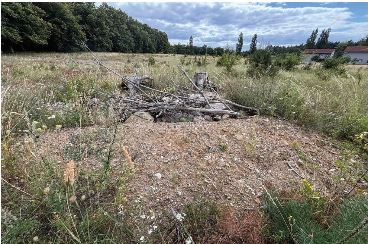
Abbildung 12: CEF-Maßnahme in Eggesin.

Die Ersatzhabitate wurden vor Beginn der Bautätigkeiten hergestellt und fachlich begleitet, ein genaues Datum der Instandsetzung konnte dem AFB für Feldberg nicht entnommen werden. Es entstanden mehrere Winterquartiere mit einer Größe von etwa 15 m 3 . Die Grubensohlen wurden mit einem Sand-Holz-Gemisch vorbereitet und anschließend mit Feldsteinen, Totholz und Bodenmaterial verfüllt, sodass frostfreie, drainierte Hohlräume als Überwinterungsstrukturen entstanden. Zwischen jeweils zwei Winterquartieren wurden Sommerquartiere aus Sand- und Kiesmaterial angelegt. Diese besitzen eine Grundfläche von mindestens 15 m 2 bei etwa 1 m Höhe und dienen als Sonnen- und Eiablageplätze. Die Substratmischung aus Sand und Kies schafft grabfähige Bedingungen und gute thermische Eigenschaften (Manthey-Kunhart 2018: 19). Vor Beginn der Umsiedlungsphase wurde die Eingriffsfläche durch eine vergrämende Mahd offener gestaltet. Zusätzlich wurde ein bodenschlüssiger Reptilienschutzzaun mit eingegrabenen Fangeimern und Fluchtrampen errichtet. Auf diese Weise konnten Tiere aus dem Eingriffsbereich kontrolliert in die neu geschaffenen Ersatzhabitate überführt werden (Manthey-Kunhart 2018: 17). Die Pflege des Ersatzhabitats wird im zuständigen AFB 2018 nicht genauer beschrieben.