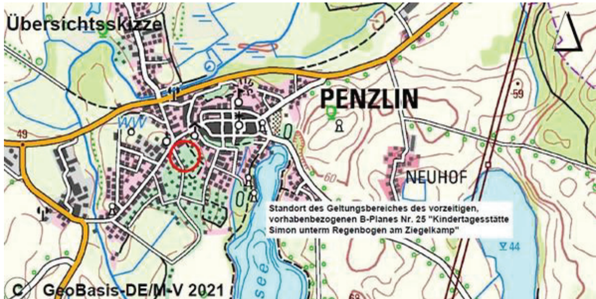
Abbildung 16, Standort CEF-Maßnahme Penzlin, Quelle: Konzept für die Errichtung eines Zauneidechsenhabitates als Ausgleichsmaßnahme zum Bebauungsplan Nr. 25 „Kindertagesstätte Simon unterm Regenbogen - Am Ziegelkamp“ Der Stadt Penzlin: 3.

Die Angaben in den Kapiteln 5.6.1 und 5.6.2 stammen aus dem Konzept für die Errichtung eines Zauneidechsenhabitates als Ausgleichsmaßnahme zum Bebauungsplan Nr. 25 „Kindertagesstätte Simon unterm Regenbogen, Am Ziegelkamp“ der Stadt Penzlin.