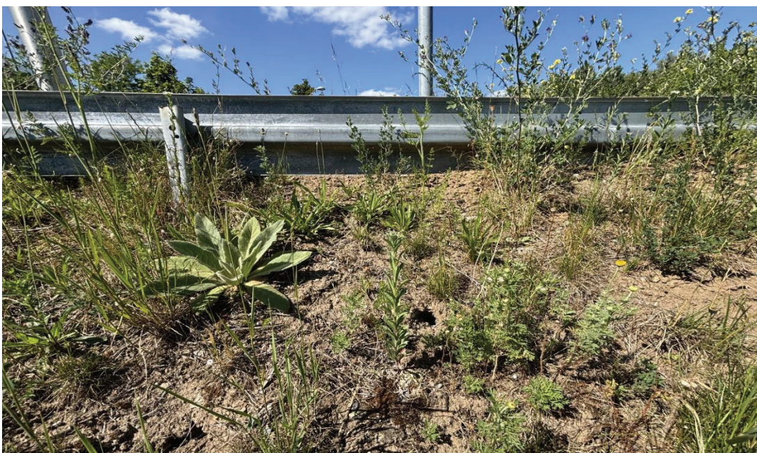
Abbildung 10: Waren, südexponierte Böschung

Am Standort Waren kann die Maßnahme insgesamt als erfolgreich eingeschätzt werden. Die räumliche Nähe zwischen ursprünglichem Lebensraum und Ersatzfläche begünstigt die Etablierung der Population erheblich und entspricht den artspezifischen Anforderungen an geringe Ausbreitungsdistanzen. Der Pflegezustand der Fläche ist derzeit sehr gut und trägt wesentlich zur Aufrechterhaltung der günstigen Habitatbedingungen bei. Verbesserungsbedarf besteht vor allem in der regelmäßigen Kontrolle des Gehölzaufwuchses, um die langfristige Offenhaltung sicherzustellen. Zusätzlich wurden Glassplitter und weiterer Müll festgestellt, wodurch Stör- und Gefährdungsfaktoren in Form eines potenziellen Verletzungs- und Brandrisikos bestehen. Eine regelmäßige Beräumung der Fläche wird daher empfohlen. Insgesamt stellt die Maßnahmenfläche derzeit eine gute und funktionsfähige Ersatzmaßnahme dar und kann im Sinne des Artenschutzrechts als erfolgreich bewertet werden.