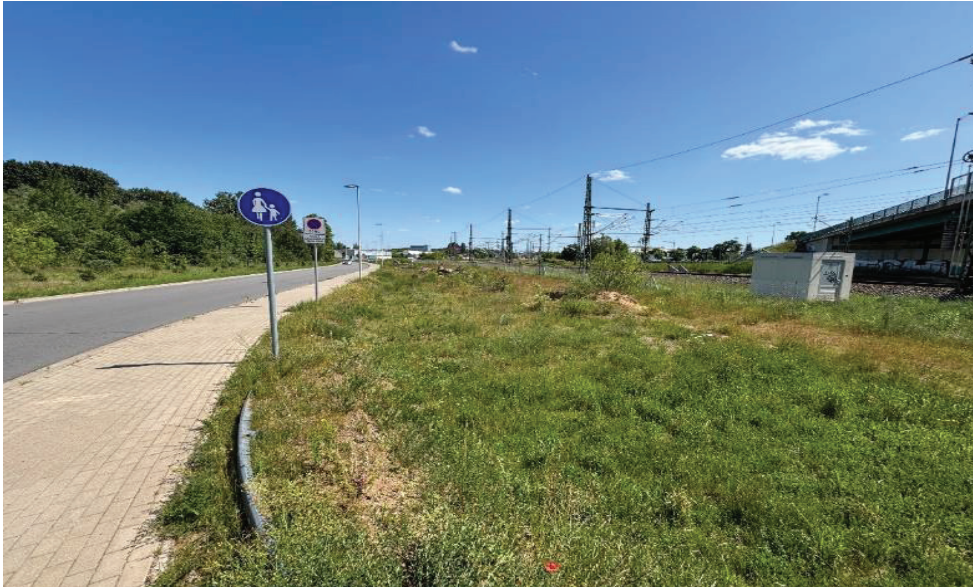
Abbildung 9: CEF-Maßnahmefläche in Waren, Quelle: Eigene Aufnahme.