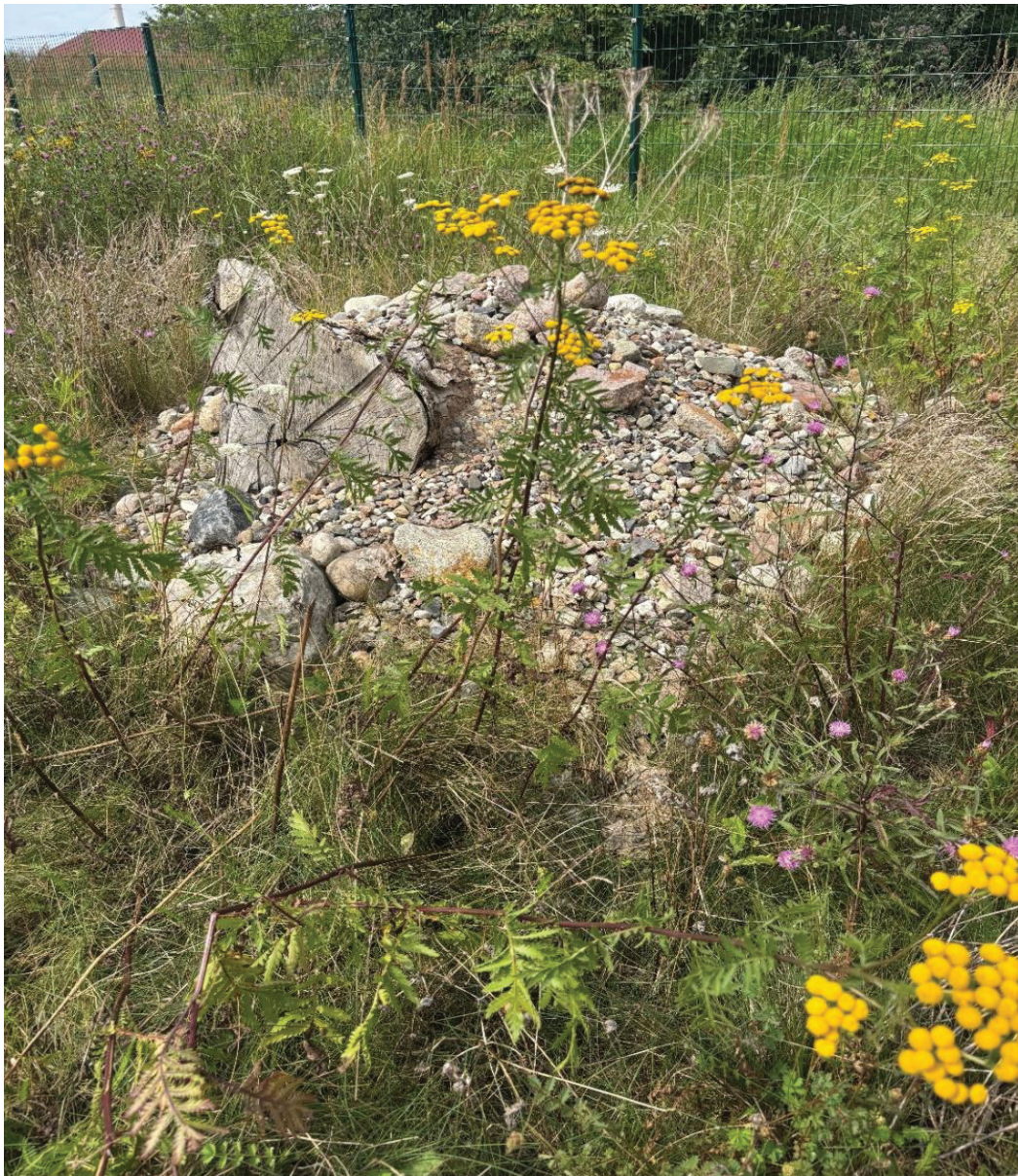
Abbildung 15: Teilfläche der CEF-Maßnahme Pribbenow.

Die Fläche besitzt grundsätzlich das Potenzial, als Lebensraum für die Zauneidechse zu dienen, erfüllt im derzeitigen Zustand jedoch die artspezifischen Anforderungen an Offenheit, Besonnung und Substratverfügbarkeit nur eingeschränkt. Zur Wiederherstellung der ökologischen Funktion sind eine erneute und regelmäßige Mahd, die konsequente Reduktion des Vegetationsaufwuchses, die gezielte Freilegung von Rohbodenbereichen sowie der Rückschnitt des jungen Pappelaufwuchses auf etwa einen Meter erforderlich. Der langfristige Erfolg der Maßnahme ist maßgeblich von einer kontinuierlichen Pflege und einem begleitenden Monitoring abhängig. Insgesamt ist die Maßnahme derzeit nur mäßig bis schlecht zu bewerten und erfordert eine konsequente Pflege, um ihre Funktion als Ersatzlebensraum tatsächlich erfüllen zu können