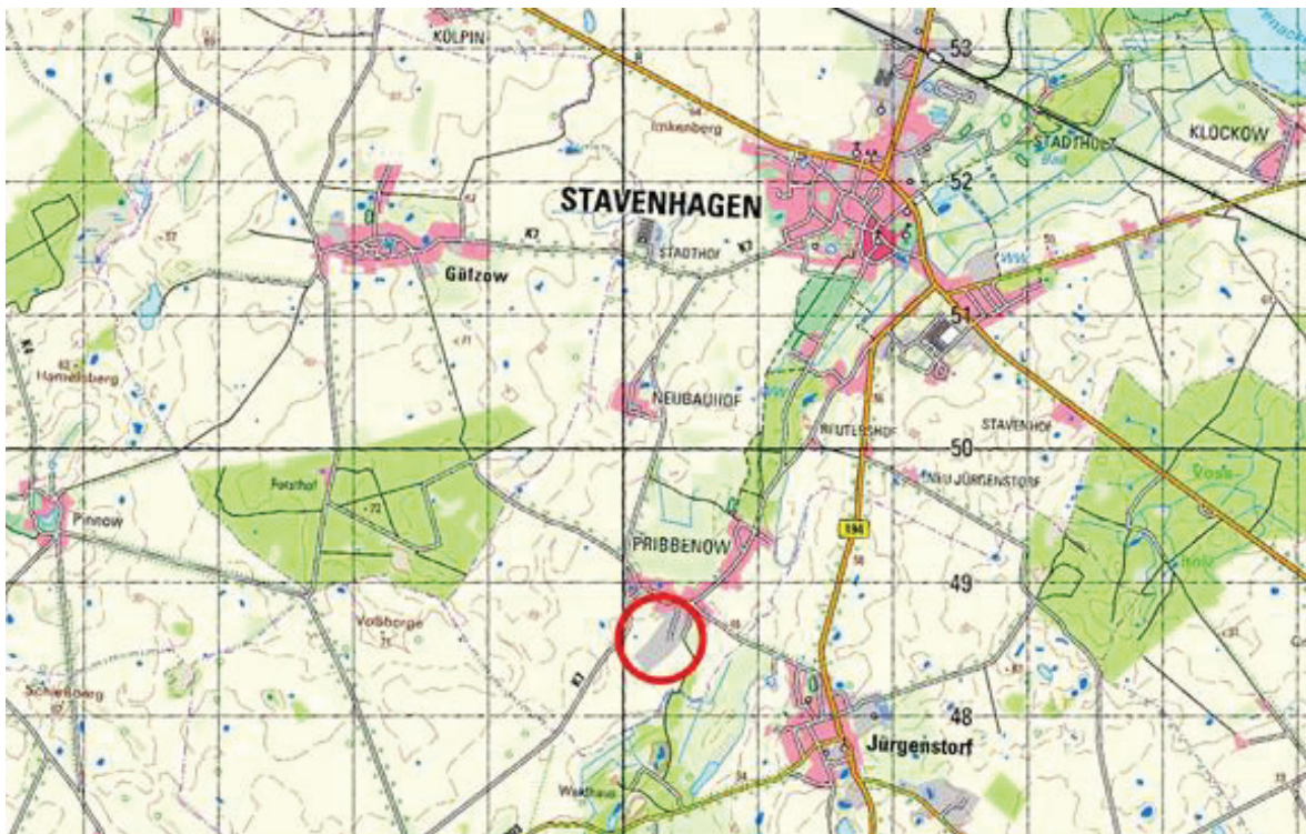
Abbildung 13: Standort der CEF-Maßnahme in Pribbenow.

Die Angaben in den Kapiteln 5.5.1 und 5.5.2 basieren auf dem Artenschutzfachbeitrag auf Grundlage des § 44 Abs. 1 BNatSchG in Verbindung mit Art. 5 VS-RL sowie Art. 12 bzw. 13 FFH-RL zum Vorhaben „Ersatzneubau von fünf Hühnerställen der Hähnchenmastanlage Pribbenow“.