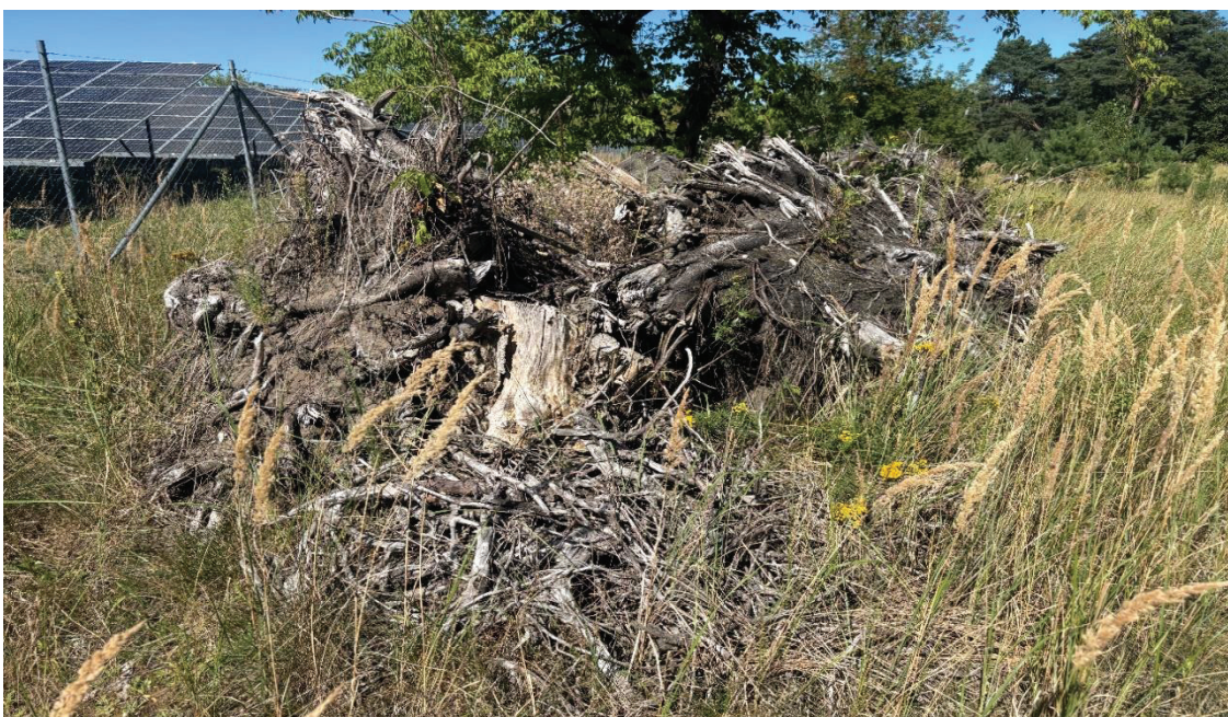
Abbildung 4: Biotopstruktur aus Totholz in Eggesin-Karpin.

Die Maßnahme erfüllt damit die wesentlichen strukturellen Voraussetzungen, um die ökologische Funktion der betroffenen Fortpflanzungs- und Ruhestätten zu übernehmen. Der Pflegezustand der Fläche ist derzeit günstig und unterstützt den Erhalt der vorhandenen Habitatstrukturen, sodass auch dieses Kriterium als gut einzustufen ist. Ein gesicherter Nachweis des Maßnahmenerfolgs kann zum jetzigen Zeitpunkt dennoch nicht erbracht werden, da im Untersuchungszeitraum lediglich eine Begehung erfolgte und die Aussagekraft daher eingeschränkt ist. Der langfristige Erfolg hängt maßgeblich von einer konsequenten Offenlandpflege sowie vom dauerhaften Erhalt der Strukturelemente ab. Weitere Erhebungen unter günstigeren Witterungsbedingungen sind erforderlich, um die tatsächliche Nutzung und insbesondere den Reproduktionserfolg am Standort verlässlich beurteilen zu können.