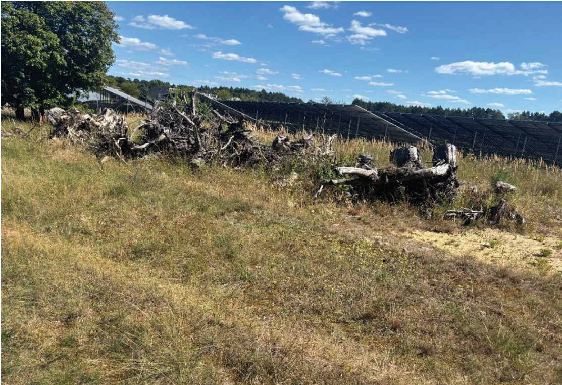
Abbildung 3: Totholzstrukturen der Maßnahme in Eggesin-Karpin.