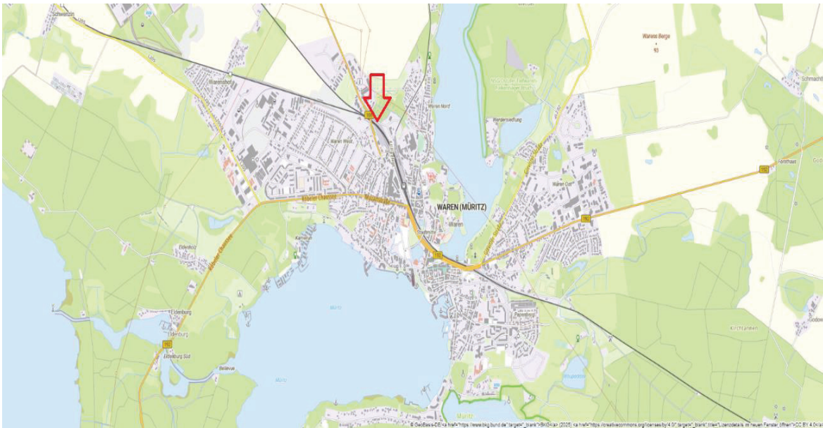
Abbildung 8, Standort CEF-Maßnahme Waren, Quelle: GeoBasis-DE/M-V, © GeoBasis-DE/M-V (2026), Darstellung: eigener Screenshot aus GAIA.

Die Angaben in den Kapiteln 5.3.1 und 5.3.2 basieren auf dem Artenschutzfachbeitrag auf Grundlage des § 44 Abs. 1 BNatSchG in Verbindung mit Art. 5 VS-RL sowie Art. 12 bzw. 13 FFH-RL und zur Berücksichtigung des Artenschutzes gemäß § 23 NatSchAG M-V zum Bebauungsplan Nr. 69 „Gewerbegebiet ehemaliges Betriebsbahngelände“