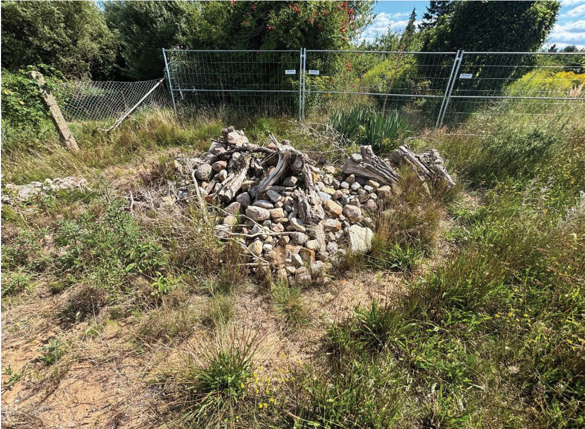
Abbildung 18: Penzlin, CEF-Maßnahme im August.