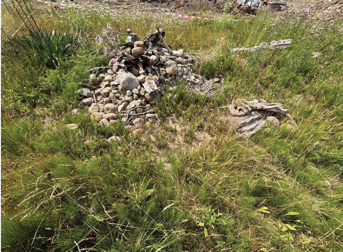
Abbildung 17: CEF-Maßnahme, Lesesteinhaufen Penzlin.

dauerhaft mindestens 70 % der Fläche ausmachen. Die angelegten Strukturelemente werden in einem fünfjährigen Turnus überprüft und bei Bedarf nachgebessert. Eine begrenzte Sukzession wird lediglich in sonnenabgewandten Teilbereichen toleriert (Kleeblatt 2023).