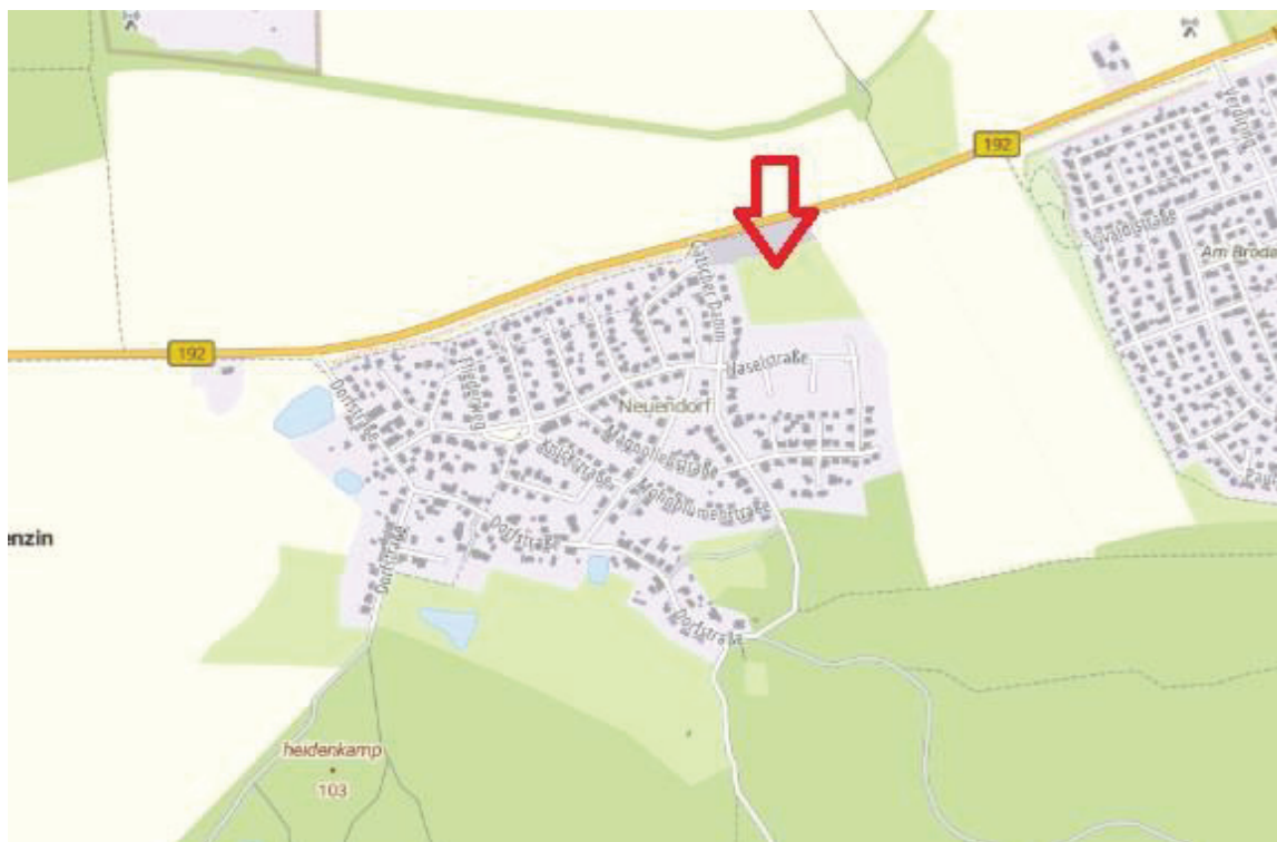
Abbildung 5, Standort CEF-Maßnahme Neuendorf, Quelle: GeoBasis-DE/M-V, © GeoBasis-DE/M-V (2026), Darstellung: eigener Screenshot aus GAIA.

Die Angaben in den Kapiteln 5.2.1 und 5.2.2 stammen aus der 3. Änderung des Bebauungsplanes Nr. 2 „Eigenheimstandort Neuendorf“, Artenschutzfachbeitrag und dem Anhang II Maßnahmeblatt A1 auf Grundlage des § 44 Abs. 1 und 5 BNatSchG.