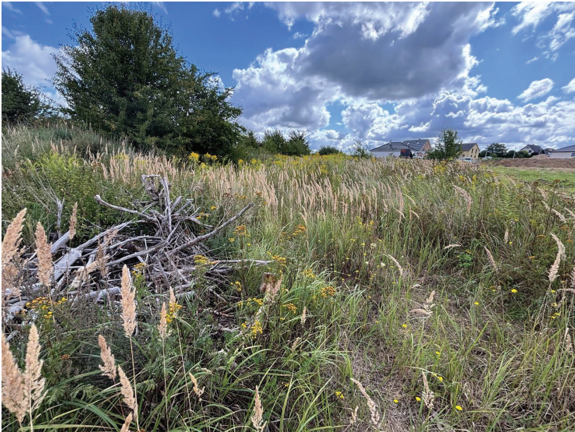
Abbildung 7: Neuendorf, zugewachsener Totholzhaufen, Quelle: Eigene Aufnahme.