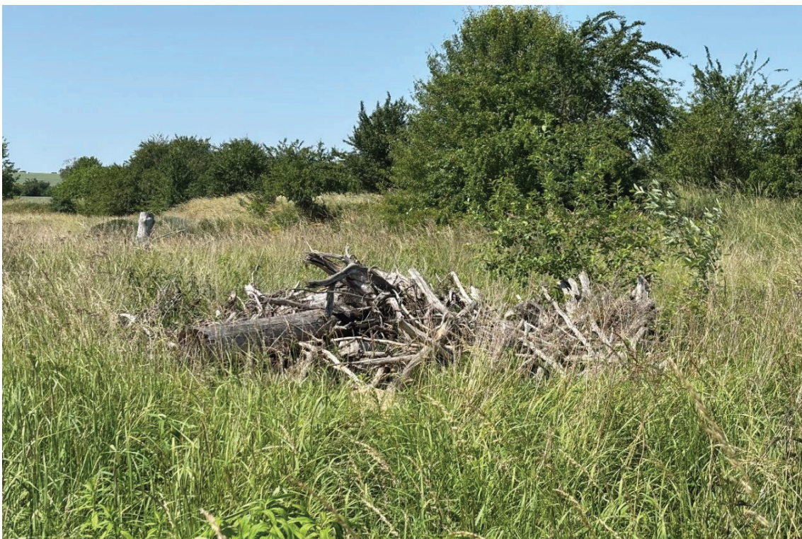
Abbildung 6: CEF-Maßnahme, Neuendorf, mit hoher und dichter Vegetation, Quelle: Eigene Aufnahme.

Der Untersuchungsstandort Neuendorf befindet sich am Ortsrand der Gemeinde Wulkenzin im Landkreis Mecklenburgische Seenplatte (Meitzner et al. 2020: 6). Die Ausgleichsfläche grenzt funktional an den bisherigen Lebensraum an und weist aufgrund ihrer offenen Struktur und der guten Besonnung grundsätzlich geeignete Voraussetzungen zur Herstellung eines Zauneidechsenhabitats auf. Im Zuge der 3. Änderung des Bebauungsplans Nr. 2 „Eigenheimstandort Neuendorf“ werden bisher geeignete Habitatbereiche im Eingriffsraum überbaut. Im Rahmen der Reptilienkartierungen 2020 wurden Zauneidechsen im Eingriffsbereich beobachtet. Ziel der Maßnahme ist die dauerhafte Sicherung der ökologischen Funktion der betroffenen Fortpflanzungs- und Ruhestätten durch die Entwicklung strukturreicher, wärmebegünstigter Habitatbereiche. Das Ersatzhabitat muss mindestens ein Jahr vor der Umsiedlung funktionsfähig hergestellt werden, um eine Habitatentwicklung und eine durchgängige ökologische Funktion sicherzustellen (Meitzner et al. 2020: 25).