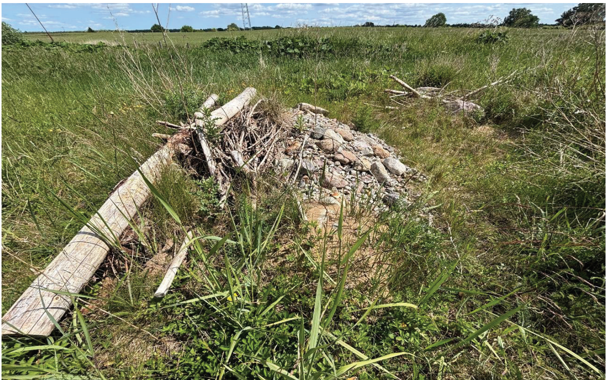
Abbildung 14: stark bewachsene CEF-Maßnahme in Pribbenow.

Da ein tatsächliches Vorkommen der Zauneidechse im unmittelbaren Eingriffsbereich nicht eindeutig nachgewiesen werden konnte, erfolgt die Umsiedlung vorsorglich. Vor und während der Bautätigkeiten wird eine vergrämende Vorpflege durchgeführt, um eine Nutzung des Baufeldes durch Reptilien zu unterbinden. Falls erforderlich, werden einzelne Individuen gezielt abgesammelt und in das hergestellte Ausweichhabitat überführt. Sämtliche Maßnahmen erfolgen unter fachökologischer Begleitung, um eine Verschlechterung des Erhaltungszustands der lokalen Population zu vermeiden (Grünspektrum 2013).