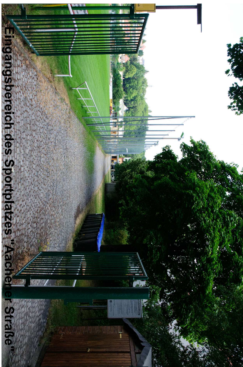
Eingangsbereich des Sportplatzes "Aachener Straße"