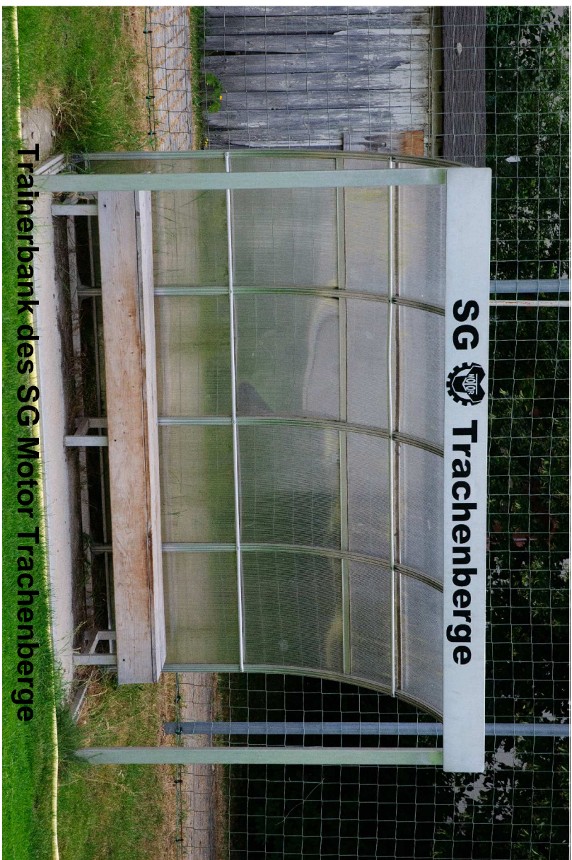
Trainierbank des SG Motor Trachtenberge