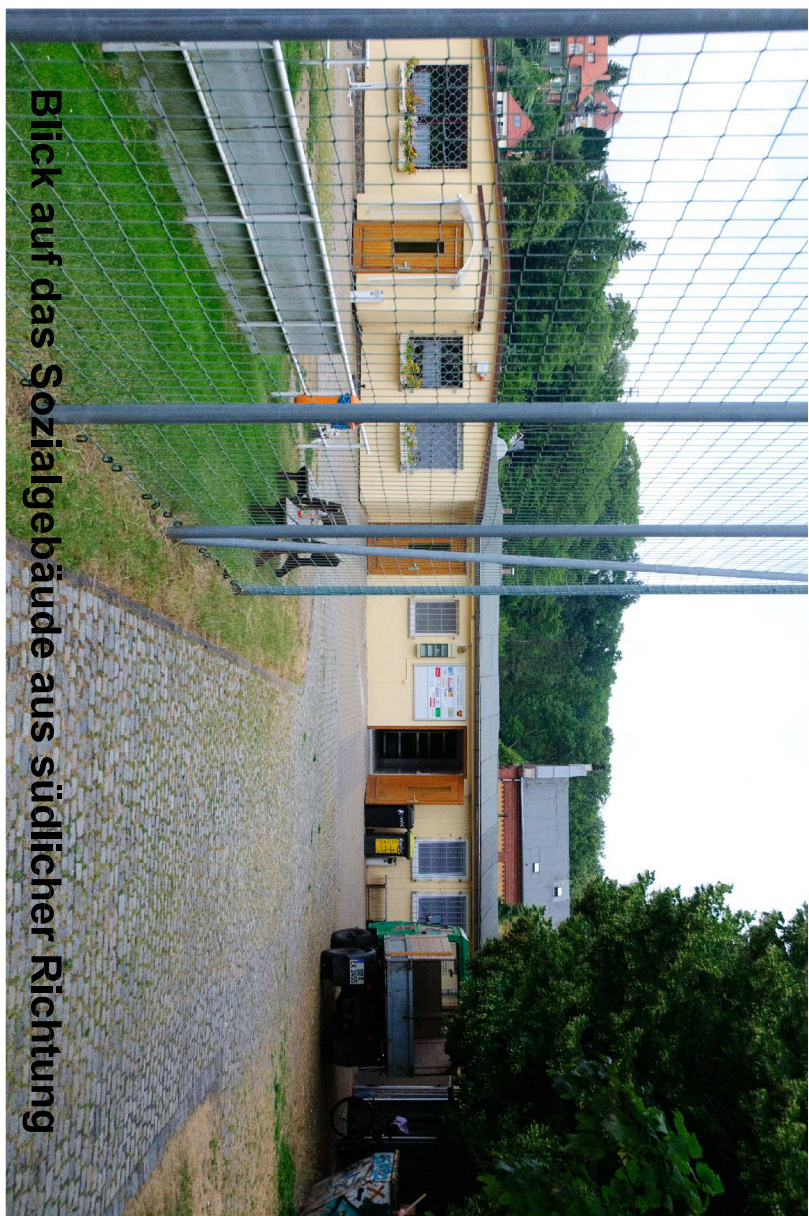
Blick auf das Sozialgebäude aus südlicher Richtung