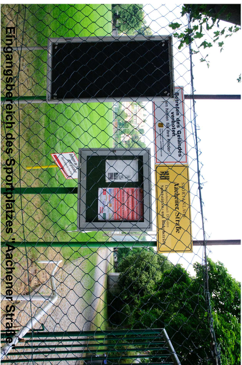
Eingangsbereich des Sportplatzes "Aachener Straße"