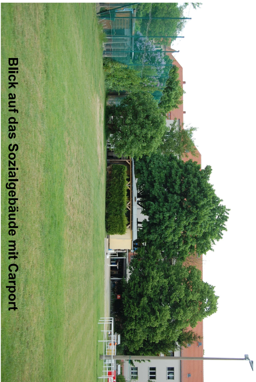
Blick auf das Sozialgebäude mit Carport