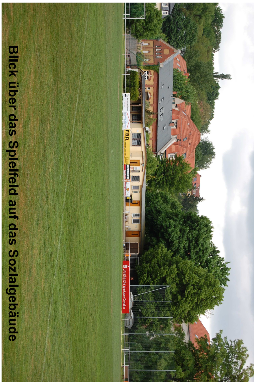
Blick über das Spielfeld auf das Sozialgebäude